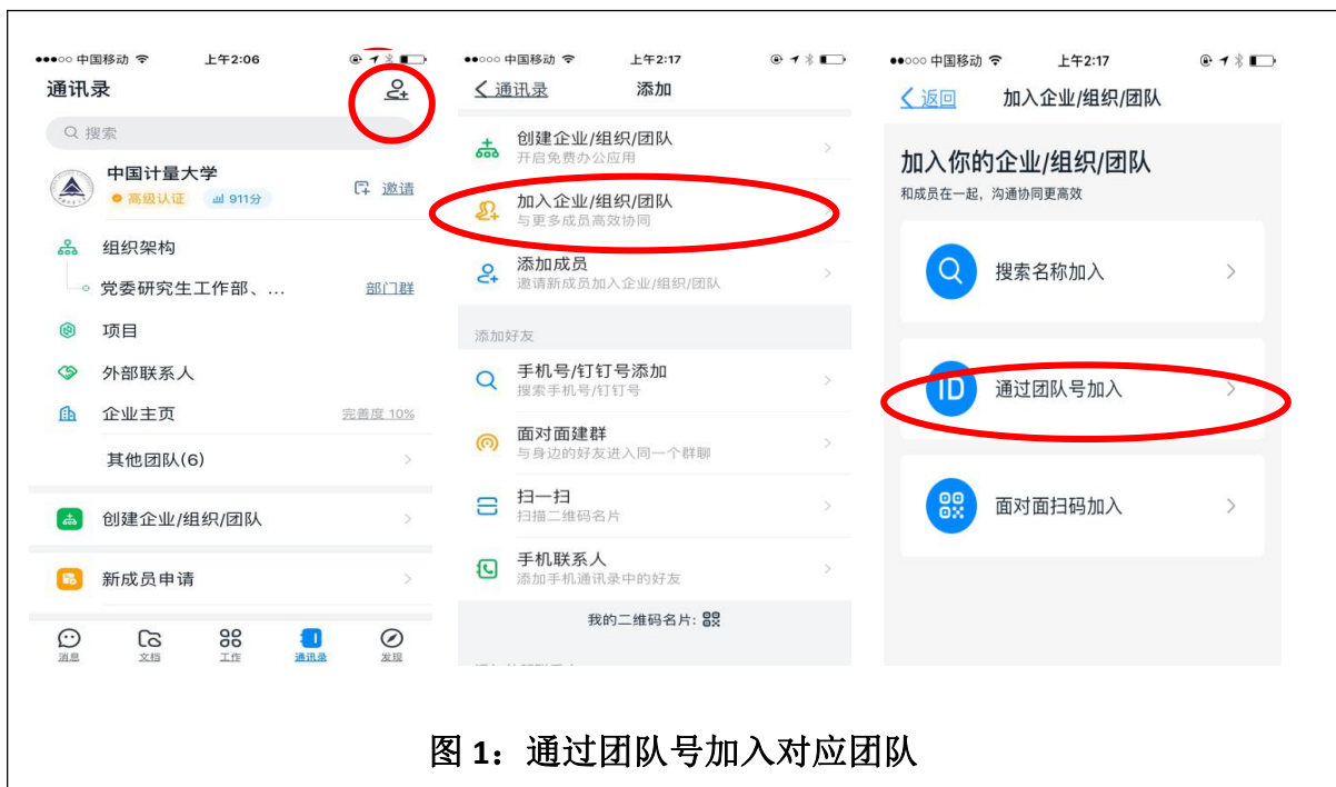
图 1：通过团队号加入对应团队

手机版钉钉——通讯录——右上角+，加入企业/组织团队，通过团队号加入，输入团队号即可申请加入，详见下图。